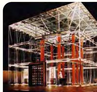
Le théâtre de verre