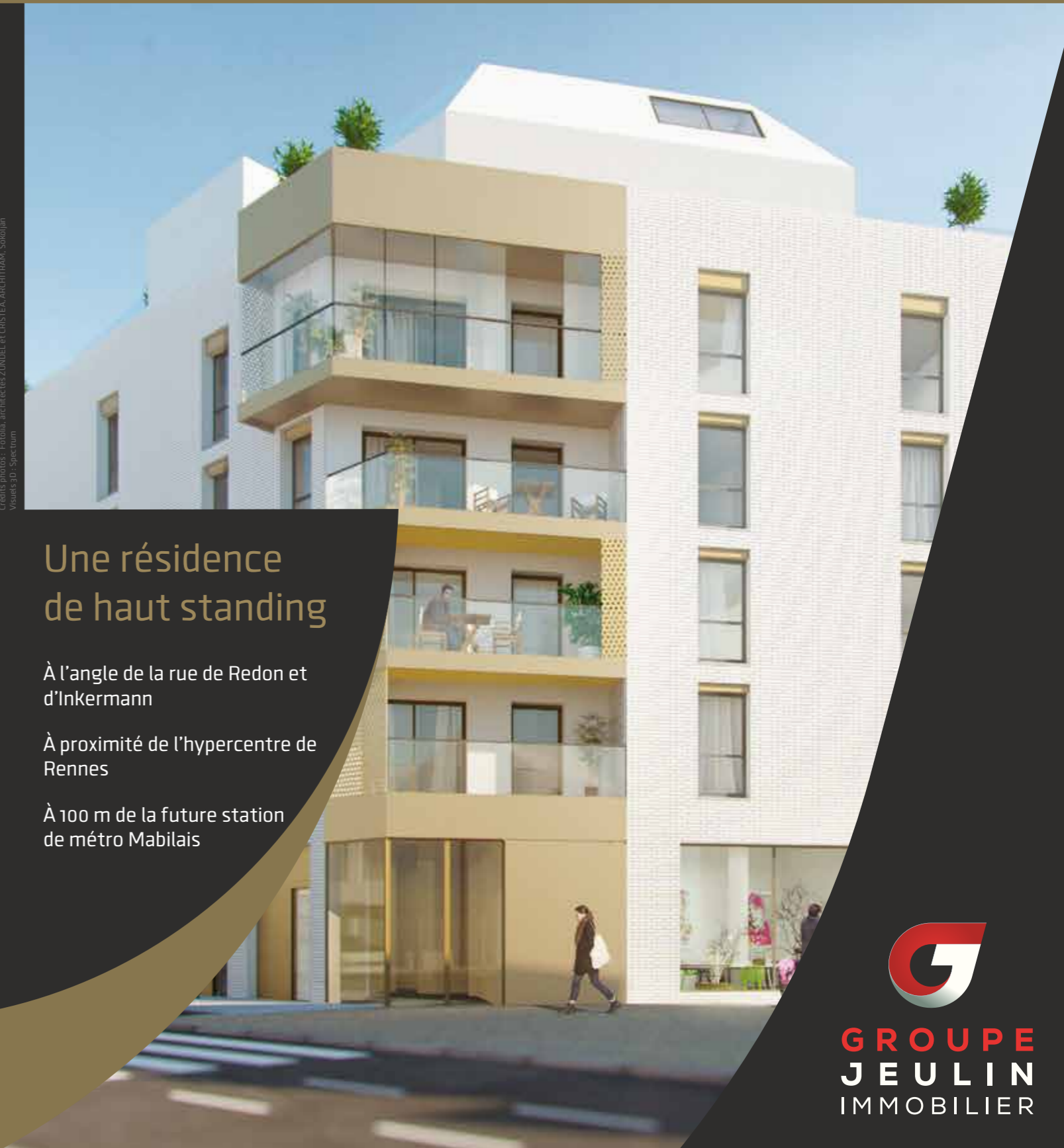
09-2016 - Document et photos non contractuels Crédits photos : Fotolia, architectes ZUNDEL et CRISTEA, ARCHITRAM, Sobolan Images 3D : Spacium

Une situation idéale proche de l'hypercentre