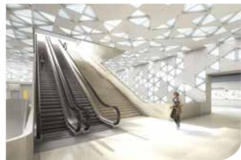
Future station de métro Mabilais